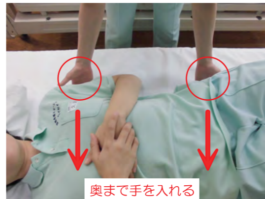
奥まで手を入れる