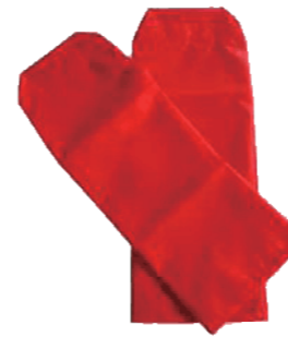
移座えもん グローブ