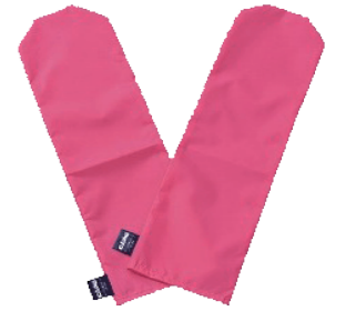
ケープ 介助グローブ