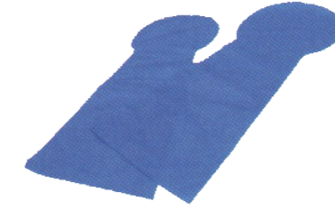
ハーディー グローブ