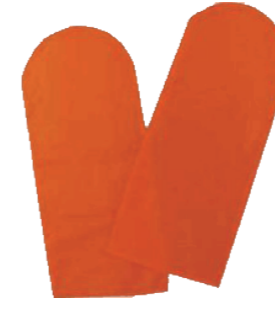
ポジショニング グローブ