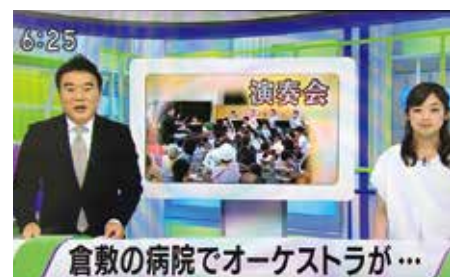
平成29年8月24日 NHK岡山「もぎたて!」