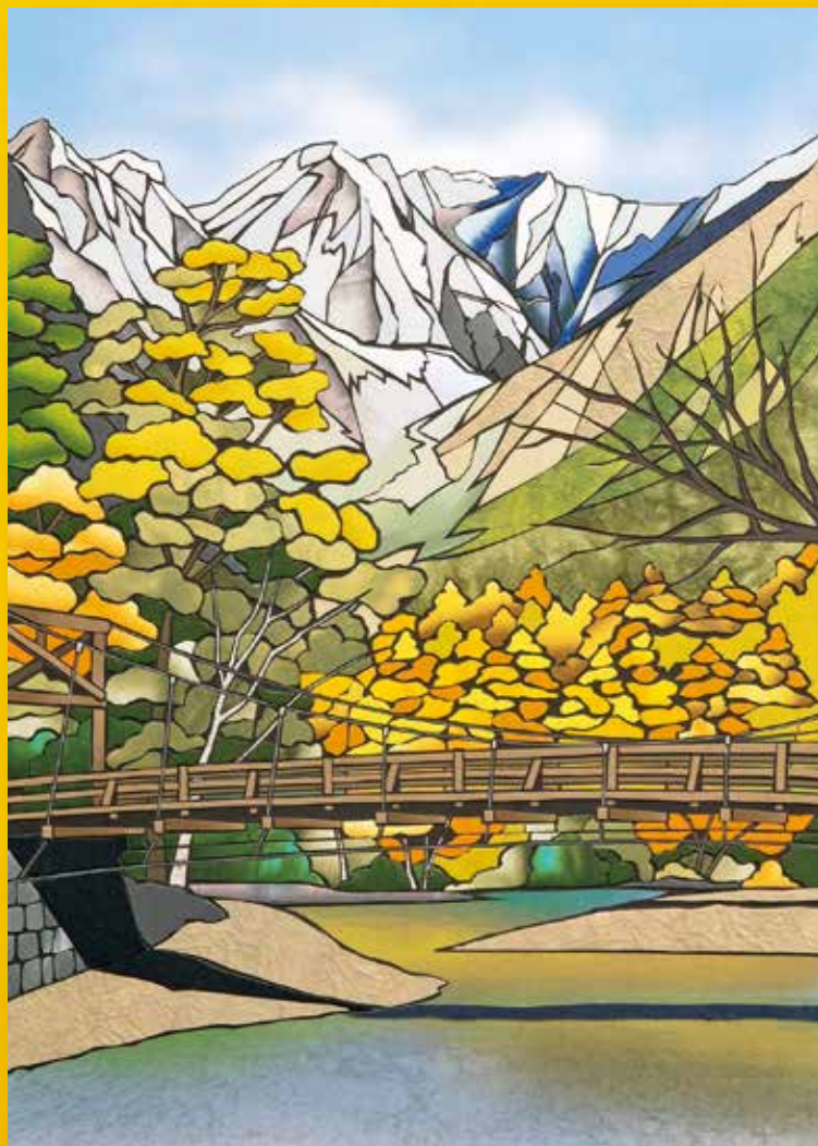
表紙：「秋の上高地」ピースガーデン倉敷 デイサービス リハビリステーション ピースの作品

社会医療法人全仁会 倉敷市老松町4丁目3-38 倉敷平成病院内 全仁会ニュース編集部 発行責任者/高尾 武男