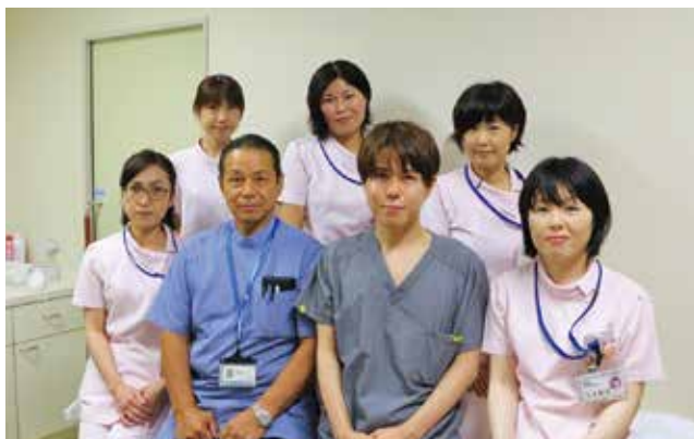
フットケア外来のスタッフ

糖尿病性障害は、糖尿病による神経障害、血流障害、感染症が原因となり、足にさまざまな症状が出ることです。神経障害による感覚の低下や足の変形が原因で胼胝や傷がでやすくなります。また、血流障害や感染症により傷が治らないことや急に悪化することがあります。