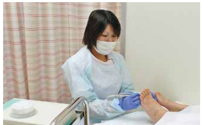
胼胝や鶏眼の処置をする看護師

年齢を重ねることで膝や足の変形を伴い歩き方が変わる方もいます。自分の足で元気に歩くためにも、日常生活では意識することの少ない足に一度着目してみてもいかがでしょうか。私たちも全力でサポートいたします。