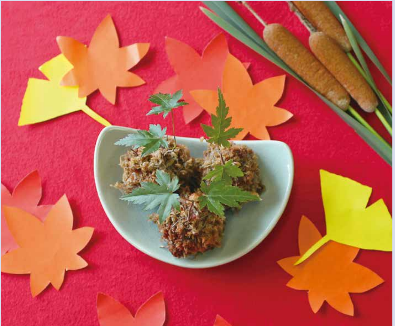
表紙：「初秋を感じて」 デイサービスドリームの方の作品

社会医療法人全仁会 倉敷市老松町4丁目3-38 倉敷平成病院内 全仁会ニュース編集部 発行責任者/高尾 武男