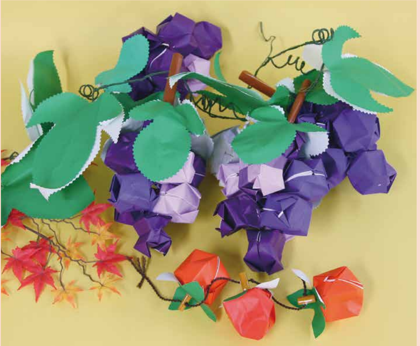
表紙：「実りの秋」通所リハビリご利用の方の作品

社会医療法人全仁会 倉敷市老松町4丁目3-38 倉敷平成病院内 全仁会ニュース編集部 発行責任者/高尾 武男